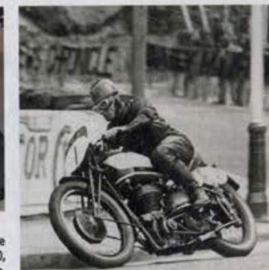
1937 : Au virage de Quarter Bridge, voici Jimmie Guthrie qui gagnera le Junior TT en 350, mais abandonnera au Senior, en 500. ▶