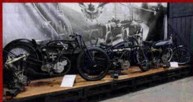
Au musée, Anzani prend beaucoup de place. Grâce à la traversée de la Manche par Blériot, Anzani s'est forgé une réputation mondiale (notez le trois cylindres du motoriste derrière les machines).