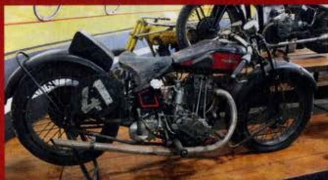
Cette Gnome & Rhône D4 de 1929 colle à la mouvance actuelle : rester dans son jus.