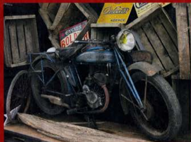
Ce joli diorama à l'échelle 1 témoigne du soin apporté à la présentation.