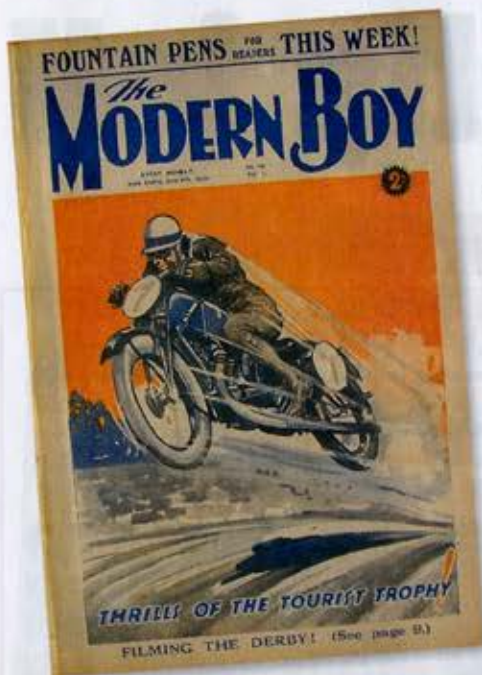
« Les courses du Tourist Trophy sont pour les "garçons modernes" ! Couverture de "The Modern Boy", 1928.