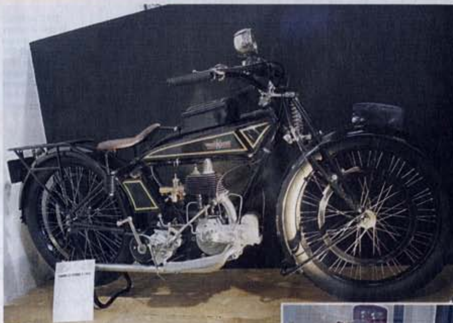
▲ Même si c'est difficile à concevoir aujourd'hui à la vue de ce modèle de 1926, la Gnome & Rhône Type C s'est bel et bien taillé la part du lion dans les années sportives à cette époque.

Ateliers des pionniers, place de la gare, (Pont-Sous) Gallardon (28). Association locomotion et mécaniques anciennes, tél. 06 07 44 47 85. E-mails : ateliers.pionniers@sfr.fr ; contact@musee-ateliers-des-pionniers.fr Site web : www.musee-ateliers-des-pionniers.fr