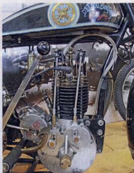
▲ Anzani sert de "fil conducteur" à l'expo, comme sur cet incroyable panachage entre un bas-moteur Anzani greffé d'un ensemble cylindre-culasse 250 cm 3 provenant d'un twin GN Salmson qui équipait des voitures de course en 1921.

« du vélo avec celui de la moto. «Que leurs histoires soient liées par des inventeurs célèbres ou la compétition, ils partagent surtout l'esprit d'innovation», annonce le panneau présentant l'exposition temporaire.