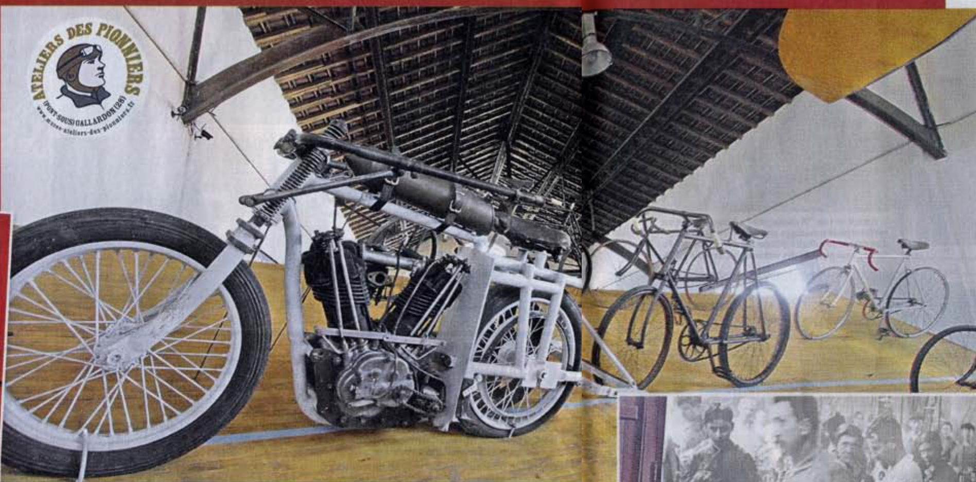
« L'expo à voir jusqu'au 1 er novembre fait le lien entre le vélo et la moto, comme sur ce morceau de vélodrome reconstitué ! »